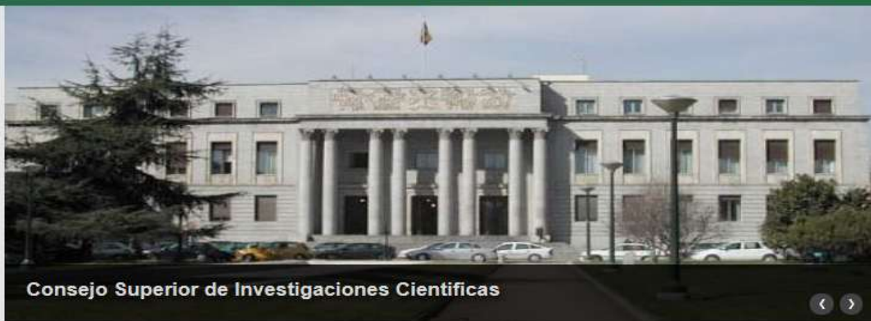
Consejo Superior de Investigaciones Cientificas